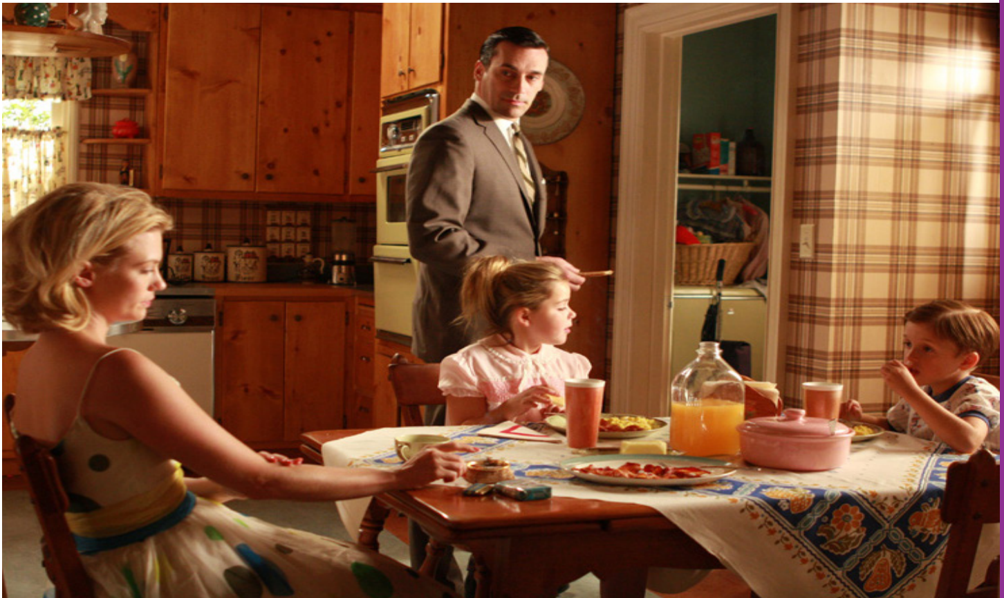
El 63% de las madres españolas afirman que todos los días tienen en mente un listado infinito de cosas por hacer, frente al 25% de padres que experimentan esta misma sensación. Fotograma de la serie Mad Men.