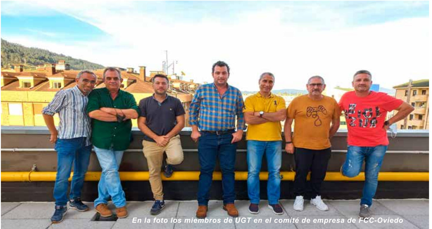
En la foto los miembros de UGT en el comité de empresa de FCC-Oviedo